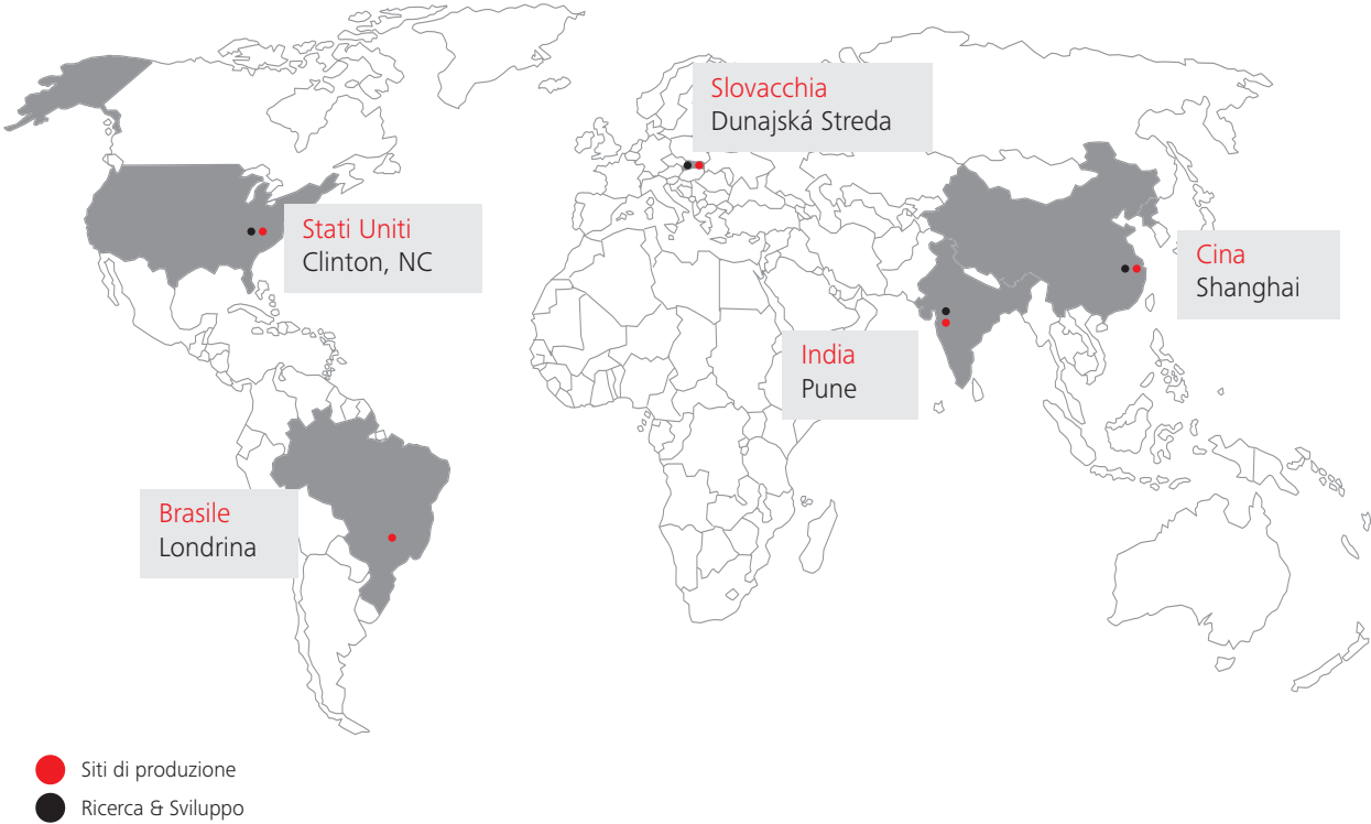
Siti di produzione e ricerca e sviluppo delle scale mobili Schindler

Schindler trasporta persone e beni e collega impianti di trasporto verticali e orizzontali con soluzioni di mobilità intelligenti basate su tecnologie energeticamente efficienti e di facile utilizzo. I prodotti di Schindler sono presenti in molti dei più iconici edifici a livello mondiale, che si tratti di complessi residenziali o di uffici, aeroporti, centri commerciali o punti vendita della grande distribuzione, ecc.