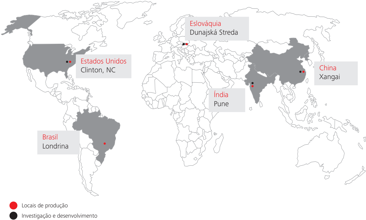
Locais de produção das escadas e esteiras rolantes Schindler

A Schindler movimenta pessoas e materiais e liga sistemas de transporte verticais e horizontais através de soluções de mobilidade inteligentes impulsionadas por tecnologias ecológicas e de fácil utilização. Os produtos Schindler encontram-se em vários edifícios conhecidos em todo o mundo, incluindo edifícios residenciais e de escritórios, aeroportos, centros/estabelecimentos comerciais e edifícios com requisitos especiais.