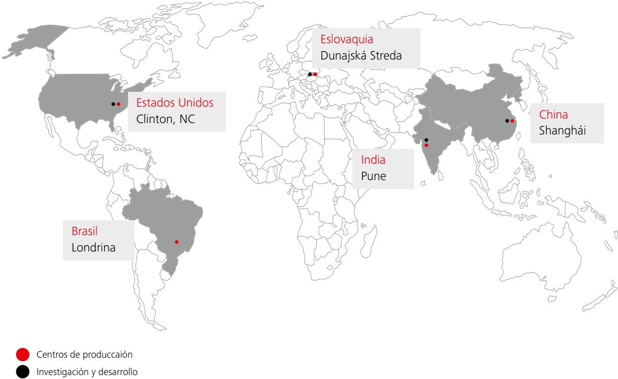
Centros de producción de escaleras mecánicas y andenes móviles Schindler

Schindler mueve personas y materiales, y conecta sistemas de transporte vertical y horizontal mediante soluciones de movilidad inteligentes, impulsadas por tecnologías ecológicas y fáciles de usar. Los productos Schindler se pueden encontrar en muchos edificios conocidos de todo el mundo, incluidos edificios residenciales y de oficinas, aeropuertos, centros comerciales, tiendas y edificios con requisitos especiales