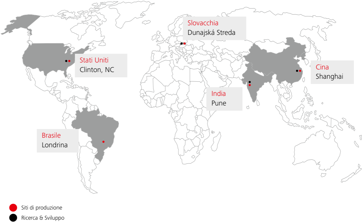
Siti di produzione e ricerca e sviluppo delle scale mobili e dei tappeti mobili Schindler

Schindler trasporta persone e beni e collega impianti di trasporto verticali e orizzontali con soluzioni di mobilità intelligenti basate su tecnologie energeticamente efficienti e di facile utilizzo. I prodotti di Schindler sono presenti in molti dei più iconici edifici a livello mondiale, che si tratti di complessi residenziali o di uffici, aeroporti, centri commerciali o punti vendita della grande distribuzione, ecc.